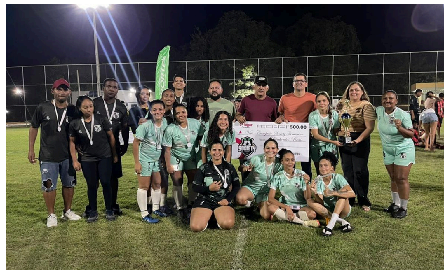
RIO SONO FC, VICE CAMPEÃ