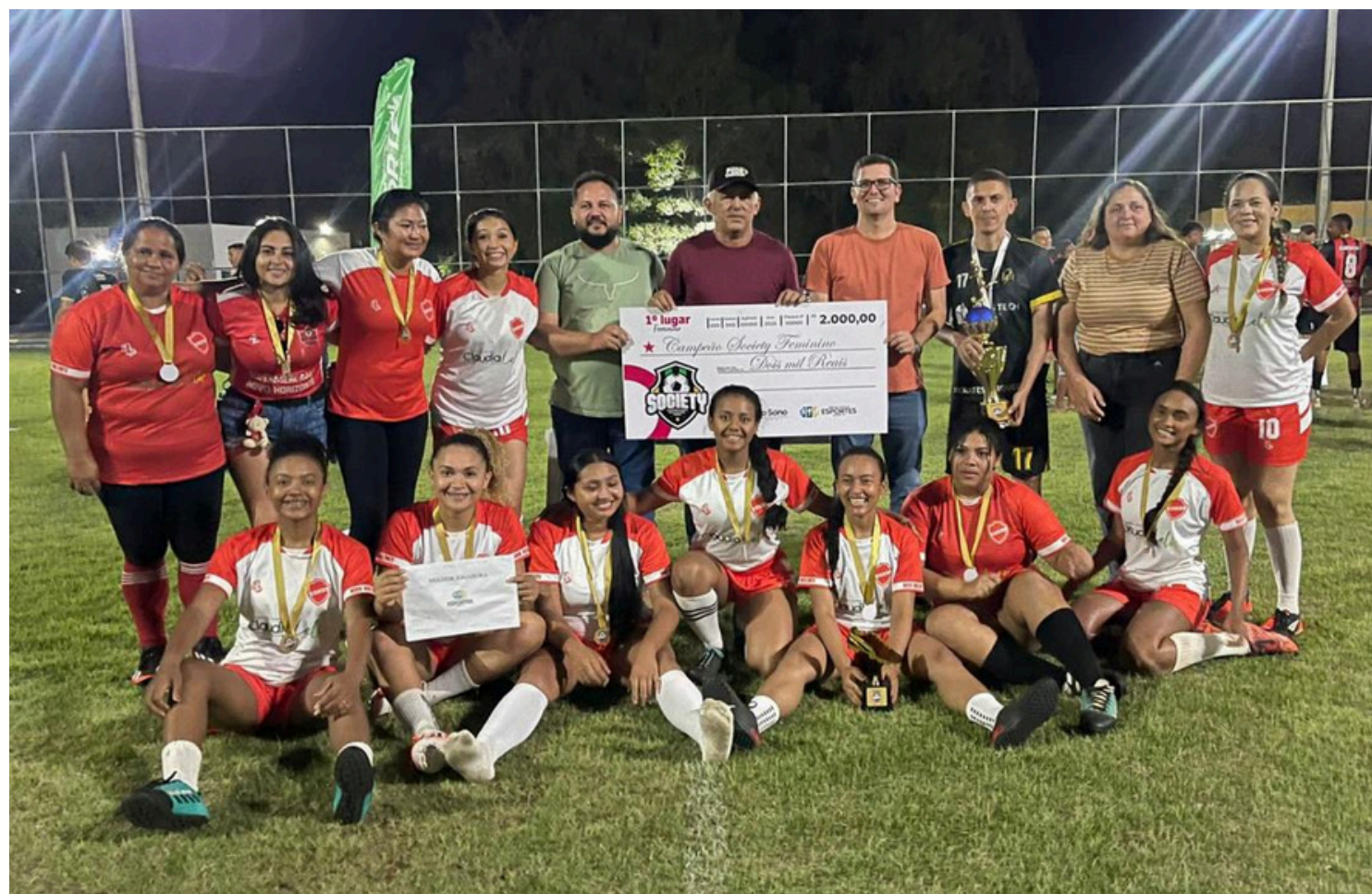
NOVO HORIZONTE E.C, EQUIPE CAMPEÃ NA CATEGORIA FEMININO